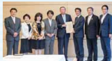
【一億総活躍】総理へ申し入れ