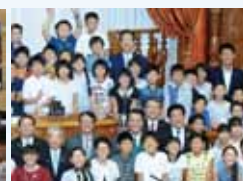
参議院70周年事業 子ども国会