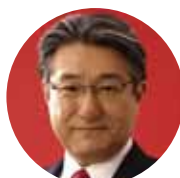
参議院議員 石田 昌宏