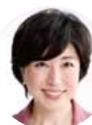
衆議院議員 木村 弥生