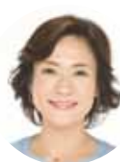
参議院文教科学委員長 参議院議員 たかがい 恵美子

春陽の候、茨城県看護連盟の皆さまにおかれましては、お健やかに過ごしのことと拝察いたします。年度替わりは例年のことながら、桜花を愛でる暇のない慌たしさと存じます。東日本大震災後8度目の春を迎え、県内においても新たな拠点で創生への歩みを進める方々の力強いお姿に触れる機会が徐々に増えてまいりました。その一方で、独居者の健康維持や長期にわたる心のケアといった‘人の手によるお世話’、身近な場所での支えがいっそう重要性を増しています。殊に今春は医療介護総合確保推進法ができて初となる診療報酬・介護報酬の同時改定が行われましたので、私たち看護職一人一人が、地域における医療や介護の現場に即した技術評価部分をしっかり取り込んで、さらなる国民福祉の向上に貢献していきたいものです。